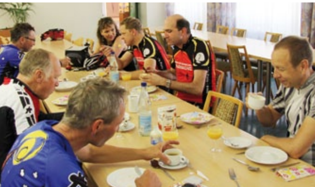
Stärkung nach einer anstrengenden Nachtfahrt: Frühstücksbuffet am Gymnasium St. Paulusheim in Bruchsal

Nach Heidelberg könnte man von hier aus problemlos in der Ebene fahren, aber die Hügel des Kraichgaus