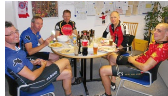
Kohlenhydrat-Aufnahme um Mitternacht im Büro des Realschulleiters der Liebfrauenschule Sigmaringen

Um 0.40 Uhr macht sich Aufbruchsstimmung breit. Das längste Teilstück von 170 km bis nach Bruchsal zollt uns einigen Respekt, aber wir haben uns ja aus freien Stücken dieser Herausforderung gestellt. Nahezu ohne Autoverkehr fahren wir in der geschlossenen Gruppe auf der Bundesstraße durchs nächtliche Lauchertal. Weil wir mit äußerst heller Beleuchtung ausgestattet sind und weil die Gruppe auf Grund der ständigen Bewegung und wegen der Leuchtwesten schon von weitem sichtbar ist, besteht so gut wie keine Gefahr, von anderen Verkehrsteilnehmern