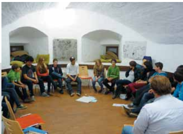
Im Forum diskutieren