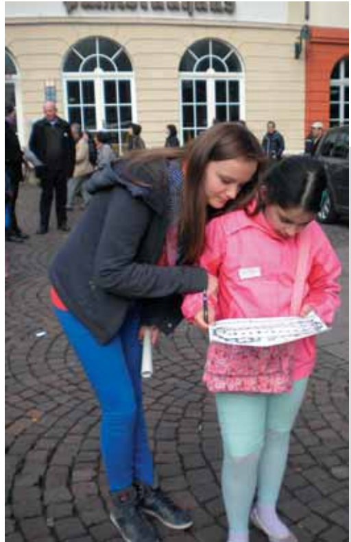
Vorplatz und Altarraumgespräch

Eine Kirche betritt man nicht wie andere öffentliche Gebäude und die Erkundung der „lebendigen Steine“ erfolgt durch einzelne Phasen der Begegnung und Erschließung. Hierbei dienen folgende Gedanken als Planungs- und Durchführungshilfen. Dabei wird der Kirchenraum bei jeder kirchenpädagogischen Begegnung als liturgischer Ort verstanden und es soll zu vorgottesdienstlichen Formen eingeladen werden.