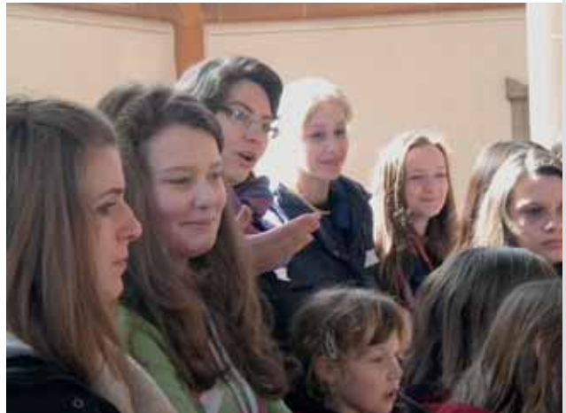
Kirchenpädagogische Führung zum Thema Passion mit Schülerinnen der St. Raphael-Realschule: Kirchenführung im Rahmen des Ferienprogramms Heidelberg (Heiliggeistkirche Heidelberg)