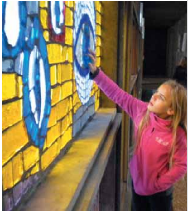
Weinheim, Markusgemeinde (Fenster)