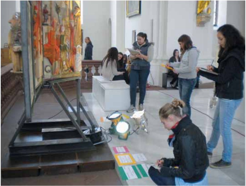
Passionsaltar von Bernhard Apfel in der Jesuitenkirche Heidelberg