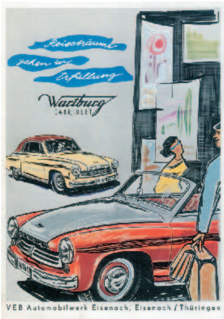
Anzeige für das Wartburg Cabriolet in der exquisiten DDR-Frauenzeitschrift Sibylle vom März 1957