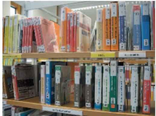
DVDs und Videos nach Themen aufgestellt