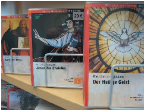
Didaktische DVDs: Ausleihe und Verkauf