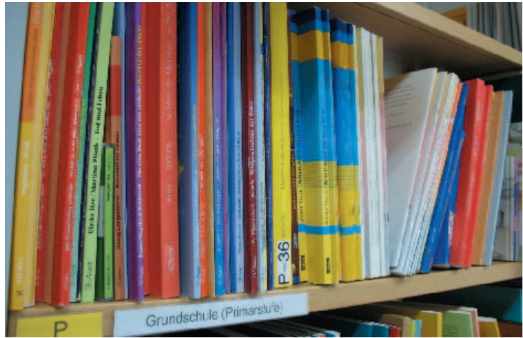
Sach- und Schulbücher