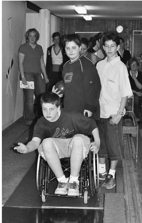
Kegeln im Rollstuhl – eine völlig neuartige Bewegungserfahrung für behinderte und nicht behinderte Menschen