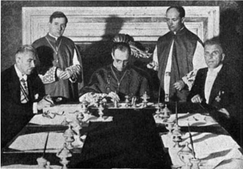
Eugenio Pacelli, der spätere Papst Pius XII, unterzeichnet das Reichs-Kondordat

ventionen, persönliche Beziehungen und Briefe mehr informeller Art. Natürlich bemühte man sich, über die jeweiligen akkreditierten Gesandten der Staaten beim Heiligen Stuhl in Rom selbst Einfluss zu nehmen. Auch mit den lokalen Bischöfen stand die päpstliche Diplomatie in enger Beziehung. Berühmt und beispielhaft ist der Briefwechsel, den Bischof Konrad Preysing von Berlin 1941 mit dem Papst in Bezug auf die Judenverfolgungen führte, wo der Berliner auf mehr Hilfe und einen öffentlichen Appell drängte 1 . Diese Klaviatur wurde eifrig gespielt; über die Erfolge wird noch zu sprechen sein. Weitere Mittel, die man einsetzte, waren Appelle, öffentliche Reden, päpstliche Ansprachen wie die berühmten Weihnachtsansprachen Pius XII. Schließlich konnte man sich in Deutschland des Sankt Raphaelsvereins bedienen, der im 19. Jh. für katholische Auswanderer zu deren Unterstützung gegründet worden war und bis 1941 bestand, als die Gestapo ihn auflöste. Mit seiner Hilfe konnten viele Juden auswandern. Aber in diesem Falle handelte es sich nur um Konvertierte, also getaufte Katholikinnen und Katholiken jüdischer Abstammung.