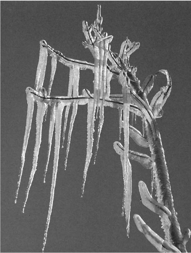
„Dreifaltigkeit“ von H_2O – Rauhreif, „fester Aggregat- zustand“ Gottes