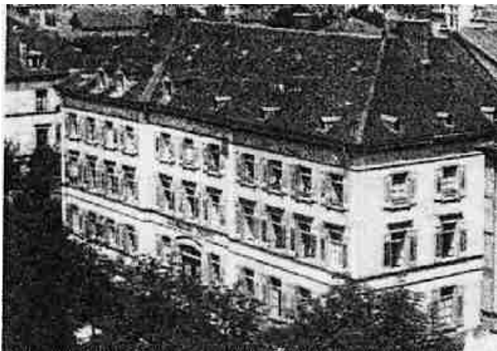
Altes St.- Ursula- Gebäude 1946