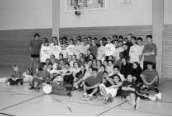
„Raphael meets Justus“ – Sport mit ausländischen und sozial benachteiligten Jugendlichen

deutschen Schüler/innen unterschiedlicher Religionszugehörigkeit will „Raphael meets Justus“ tatkräftig unterstützen. Mit der Einladung zu der traditionellen Friedensveranstaltung der Justus-von-Liebig-Schule, die im Zeichen des Abraham-Pokals der Gesellschaft für christlich-jüdische Zusammenarbeit Rhein-Neckar e.V. im Schuljahr 2003/2004 als interreligiöse Begegnung angelegt war, geht diese Partnerschaft deshalb konsequenterweise auch über den Sport hinaus.