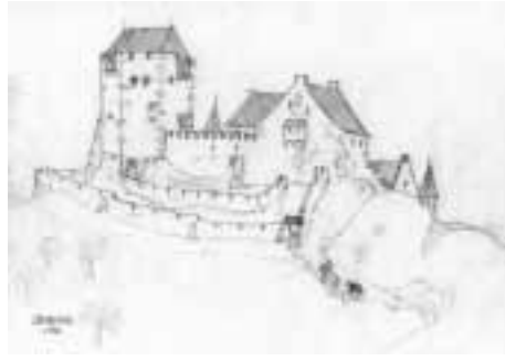
Seitenansicht der Limburg bei Sasbach am Kaiserstuhl: Annäherung an eine Idee (Skizze der Burganlage im optimalen Bauzustand von Ignaz Eberenz)