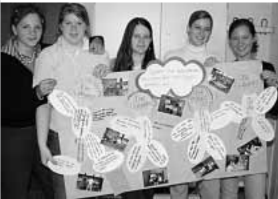
Arbeitsgruppe mit „Sport und Compassion-Plakat“

Für die Getränke- und Essensausgabe (Frühstück und Mittagessen) sowie für die Betreuung der Küche (Brötchen belegen, Salate und warmes Essen vorbereiten, Geschirrspülen etc.) und den Tischdienst, aber auch für Schreibarbeiten im Wettkampfbüro (Spielergebnisse in Spielpläne eintragen, nach der Vorrunde Spielpläne für die Endrundenbegegnungen schreiben) standen wir ebenfalls gerne zur Verfügung.