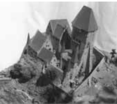
Ausgeführtes Eberenz-Modell mit Burgfelsen: wehrhafte Landschaft“ (ebenfalls in der Zinnfigurenklausur im Schwabentor)

Nur per Modell ist ja auch dem ewigen Streit zwischen Archäologen und Burgenforschern, ob den heute realen Ruinen mit konservierenden oder restaurierenden Bestrebungen besser gedient sei, zu entrinnen, zugleich jedoch ein Eindruck von Raumtiefe optisch wie haptisch zu vermitteln. Bei fast allen seinen Anlagen zielt Eberenz auf das Optimum, den mutmaßlich finalen Bauzustand gegen Ende des 14. Jahrhunderts, bevor sich die politische wie wirtschaftliche Macht auf die Städte verlagerte und viele der Burgen Beschießungen und Zerstörungen ausgesetzt waren. Natürlich muss immer wieder, wo Quellen und Kenntnisse zu lückenhaft sind, mit Phan-