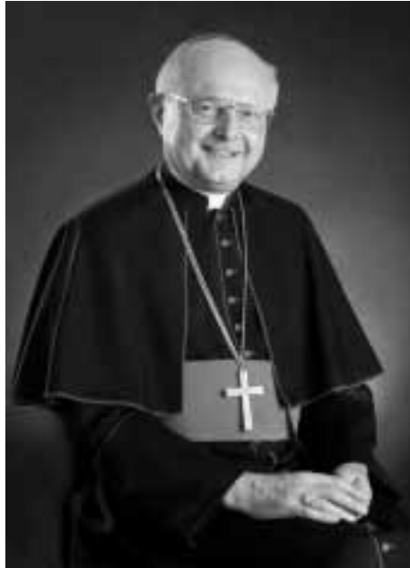
Erzbischof Dr. Robert Zollitsch

Freie Schulen sind gefragt. In diesem Schuljahr besuchen rund 370.000 Schülerinnen und Schüler in der Bundesrepublik eine katholische Schule, davon ca. 13.000 Kinder und Jugendliche Schulen der Schulstiftung in der Erzdiözese Freiburg. Im Schnitt gibt es in unserer Erzdiözese 50% mehr Anfragen von Eltern, die ihr Kind gerne auf eine katholische Schule schicken möchten, als Plätze zu Verfügung stehen. Auch wenn man davon ausgehen kann, dass diese Eltern, die sich bewusst für eine katholische Schule entscheiden, sich nicht in erster Linie gegen eine vielleicht als defizitär oder wertfreie staatliche Schule abgrenzen, so legt es sich doch nahe, die Frage nach dem „Mehrwert“, nach dem, was unsere Schulen auszeichnet und schließlich anziehend macht, zu stellen. Zugleich erlaubt eine Analyse der gegenwärtigen Situation auch erste Ausblicke auf eine zukünftige Schwerpunktsetzung und Profilierung, ohne sich dabei vorrangig von anderen, den staatlichen Schulen, absetzen zu wollen, sondern um das Eigene, die Grund- und Ausgangslage stets neu in den Blick zu nehmen.