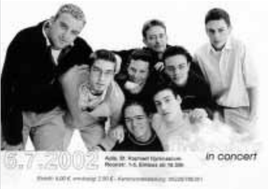
St. Raphael-Schulband „Five Seasons“

achtliche Spende in Höhe von € 500.-, was wiederum die Heidelberger Rhein-Neckar-Zeitung mit einem Foto und einem kurzen Bericht honorierte. Nicht nur der Sport, auch die Musik verbindet und bringt Menschen einander näher. Ohne die begeisterten Fans der Werkstatt Neckarau wäre das zweite Konzert der Schulband im April 2003 gar nicht denkbar gewesen.