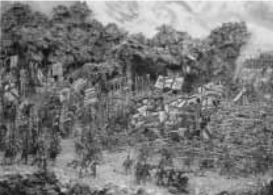
Zinnfiguren ziehen in die Schlacht von Sempach bei Zürich 1386: lebendiger Geschichtsunterricht in der Freiburger Zinnfigurenklausur im Schwabentor

der Zunftrolle den Zinn- und Kandelgießern bestimmt worden, „allein Kindswerk“, also Spielzeug, herstellen zu dürfen. 10 Freilich ließen sich Schlachten damit nicht nur vor-, sondern auch nachstellen, und so mancher pensionierte Militär ließ seine Sammlung bunter Figuren auf Bücherbrett oder Vertiko in der von ihm selbst einst bestimmten Schlachtordnung wieder auferstehen. Diese Tradition hält die Freiburger Zinnfigurenklausur lebendig, ein „Museum zur Darstellung von Geschichte in Dioramen“ (beheimatet im Schwabentor), beispielsweise in der mithilfe von 1150 Figuren inszenierten Sempachschlacht vom 9. Juli 1386. 11 Auf der einen Seite ist die Ritterschaft wohl-