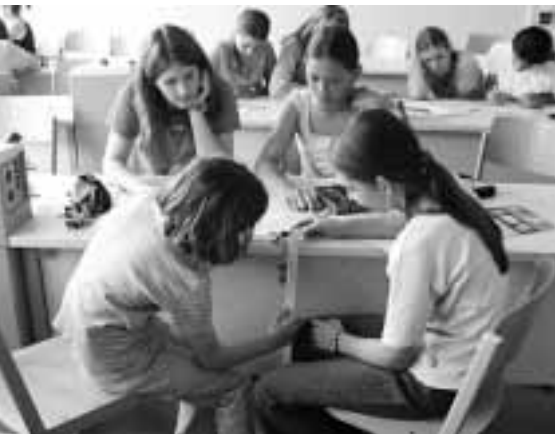
Schülerinnen einer 6. Klasse experimentieren im Fach Naturphänomene mit LEGO-dacta-Bausätzen.

Zunächst wird im Unterricht das Original mit den Bausätzen nachgebildet und die Funktionsweise sowie der Betrieb am Modell erläutert. In einem zweiten Schritt erstellen dann die Schülerinnen mit der vorhandenen Software am PC ein Programm, mit dem die zumeist mikroprozessorgesteuerten Mess- und Regelkreise am Modell wirklichkeitsnah simuliert werden.