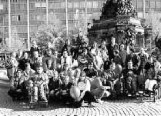
Projekttag 1998: Rolli-Ausflug mit der WfbM

Menschen aus Neckarau am Schulfesttag rundeten die Projekttag 1998 sportlich-spielerisch ab. Sogar beeindruckend gestaltete Foto-Collagen entstanden und – unter der redaktionellen Leitung des Deutschlehrers Dr. Hüge – eine künstlerisch verschönerte Projektzeitung mit den persönlichen Erlebnisberichten der Projektteilnehmer/innen.