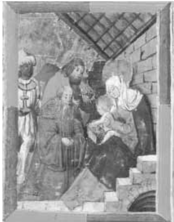
Die Krippe als Lehrmodell des Glaubens: Hohe Nacht und guter Stern!