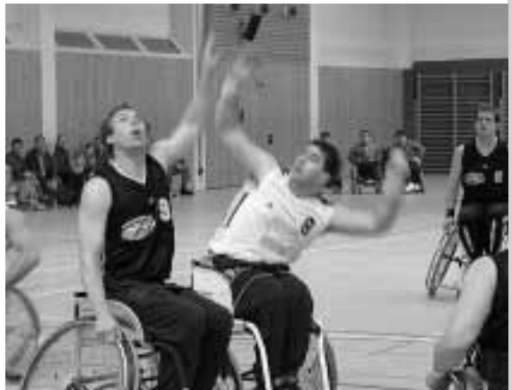
Bundesligaspiel der Rollstuhl-Basketballer der SG Heidelberg-Kirchheim