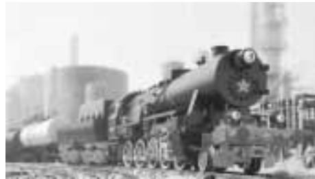
Modell dampflokomotive mit sozialistischer Ikone am Kessel: Der Russe kommt! – aus Göppingen

Die emotionale Qualität der Ansprache fordert eine mentalitätsgeschichtliche Deutung geradezu heraus. Zunächst bedient die Lokomotive das auch heute noch abrufbare, von Konrad Adenauer bis zum Exzess bemühte Angstsyndrom „die rote Flut“.