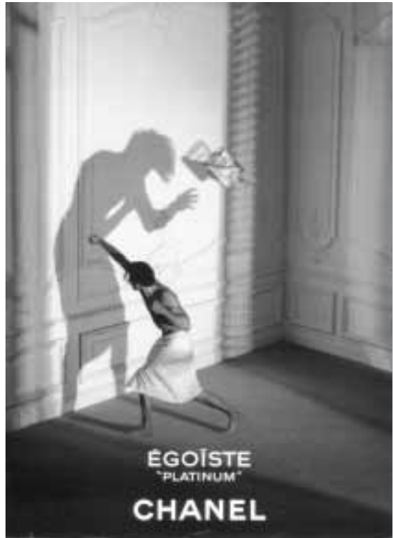
Egoismus als „cooles“ Menetekel?: Herren-Parfüm-Werbung von 1995 (aus: Dirk Schindelbeck. Marken, Moden und Kampagnen. Illustrierte deutsche Konsumgeschichte, Darmstadt 2003, S. 115)