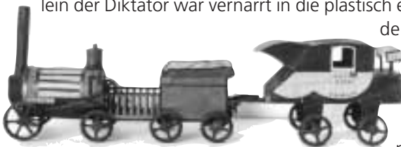
Goethes Eisenbahn, ein pädagogisches Modell: Völkerverbindung durch „Locomotion“

Weit besser als eine perspektivische Zeichnung macht offenbar das Modell Träume handgreiflich: die Vision bekommt Umrisse und die Phantasie Flügel. Doch nicht allein der Diktator war vernarrt in die plastisch einherkommende Idee, schon der