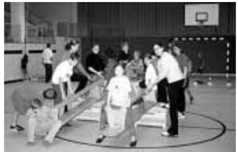
Sport in einer Kooperationsklasse mit dem Studententhema „Alles rückwärts“

Selbst eine kurze Sportunterrichtseinheit über drei Doppelstunden mit schwerhörigen und gehörlosen Grundschüler/innen und Zehnt- bzw. Elftklässler/innen oder auch nur ein Sportvormittag mit einer Kooperationsklasse geistig behinderter und nicht behinderter Grundschüler/innen hilft Hemmschwellen zu überwinden und einen – zwar kurzen – Einblick zu gewinnen, der die St. Raphael-Schüler/innen zumindest zu sensibilisieren vermag für die besonde-