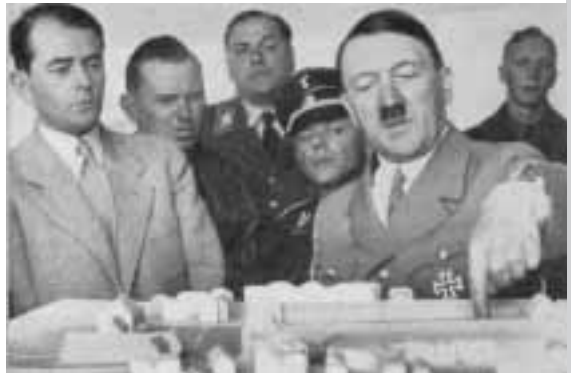
Der Diktator und sein „Hofbaumeister“ vor Berlin-Modell: Größenwahn im Miniformat

Prachtvoll sollte sie sein, majestätisch, monumental, Stein gewordener Rausch aus Glanz und Macht. Wie sich Berlin hingegen darbot, gefiel dem Führer nicht: gemessen an „richtigen“ Metropolen wie London oder Paris ein Haufen von fünfzig Dörfern. Mindestens 120 Meter breit sollte denn auch die Magistrale der künftigen Hauptstadt werden, wenigstens 20 Meter breiter und zweieinhalb mal länger als der Champs Élysées. Bekanntlich wusste Albert Speer, des Diktators „Hofbaumeister“, solchen Großmachtphantasien kongenial zu entsprechen – mit Skizzen und Plänen und immer wieder mit Modellen und Dioramen: „Besonders begeisterte Hitler ein großes Gesamtmodell, das die geplante Prachtstraße im Maßstab 1:1000 zeigte. Es war in Einzelteile zerlegbar, die auf Rolltischen herausgezogen werden konnten. An beliebigen Punkten trat Hitler so ‚in seine Straße‘, um die spätere Wirkung zu prüfen: beispielsweise nahm er die Perspektive des Reisenden ein, der am Südbahnhof ankam. Er kniete dazu fast nieder, das Auge einige Millimeter über dem Niveau der Modellstraße, um den richtigen Eindruck zu gewinnen. Nie sonst habe ich ihn so lebhaft, so spontan, so gelöst erlebt wie in diesen Stunden.“ 1