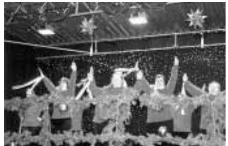
Weihnachtsmarktauftritt der „WfbM-Tanzteufel“

Seither ist die Partnerschaft mit der WfbM Neckarau zu einer engen Freundschaft gewachsen. Wenn Helfer bei sportlichen Großveranstaltungen (wie beim Sommersportfest oder beim Tischtennisturnier aller Diakoniewerkstätten des Rhein-Neckar-Kreises) oder wenn „Raphaelo-Fans“ (wie beim alljährlichen Mannheimer Weihnachtsmarkt-Auftritt der Werkstatt-Tanzgruppe „Tanzteufel“ oder bei den Schwimmwettbewerben der „Special Olympics“ für geistig behinderte Menschen) gebraucht werden, genügt ein Anruf von der WfbM und wir – Gymnasium wie Realschule – sind da. Umgekehrt können wir uns – nicht nur im Rahmen von Projekttagen – jederzeit während des Schuljahres melden, um