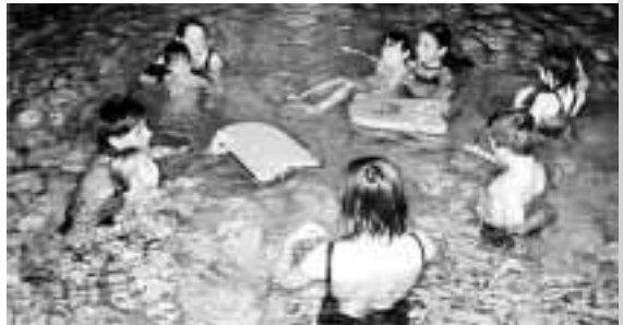
Siebtklässlerinnen helfen beim Schwimmunterricht

Ähnlich „entscheidungserleichternd“ für einige teilnehmende Schüler/innen bezüglich der Wahl des Compassion-Praktikumsplatzes verliefen die bisherigen Besuche in der Stephen-Hawking-Schule für körperbehinderte und nicht behinderte Kinder und Jugendliche in Neckargemünd, wo wir immer an einem ganz normalen Schultag Einblick in den integrativen Unterricht – mit seinen teilweise besonderen Methoden – in vielen Fächern (nicht nur im Sport) in Gymnasium und Realschule, in therapeutische Behandlungen und in das Leben der Tagesschüler/innen und der Internatsschüler/innen im Wohnheim erhalten. Compassion ist in der Stephen-Hawking-Schule ein Begriff, so die Schulleitung, und unsere St. Raphael-Praktikant/innen sind dort sehr gern gesehen.