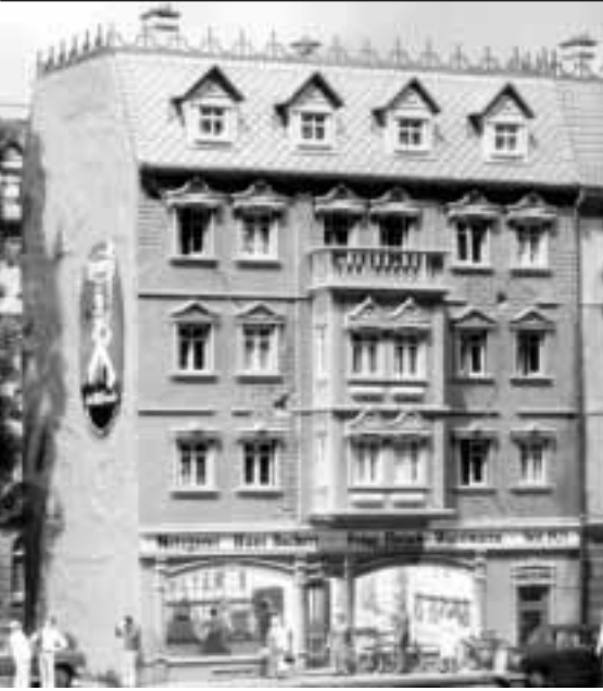
„Epochenbausätze“ für die Modelleisenbahn: Nachkriegsidyll im Hobbyraum

tionskonzept der Augenweide: sei dies nun eine detailversessen ausgeführte Straße der fünfziger Jahre mit Trümmergrundstück, Sissi-Kino und Milchbar, ein fränkisches Fachwerkdorf mit Ziehbrunnen und Ententeich oder ein Jugendstilviertel in einem Bonner Vorort: stets erzeugt das liebevoll gestaltete Aperçu Kolorit und Milieu. 20